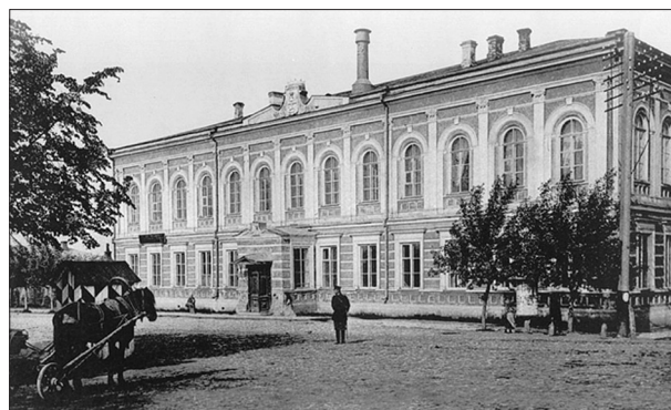
Здание Дворянского собрания, ныне Уфимская государственная академия искусств им. Загира Исмагилова